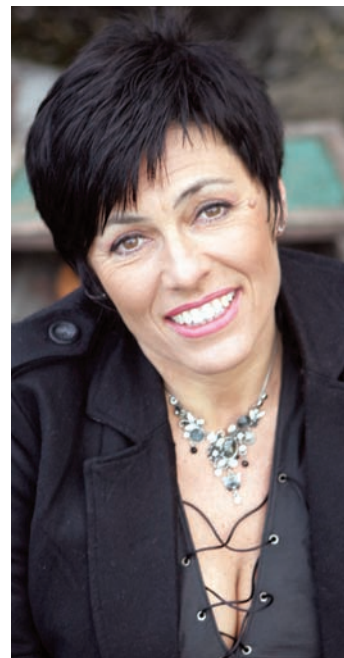
„Jsem takový jazzový bavič. Chci, aby se publikum cítilo dobře. Protože nezpívám jenom pro peníze, dělám muziku hlavně pro lidi.“

Asi George Gershwin, ale v sukni to byla určitě Ella Fitzgeraldová.